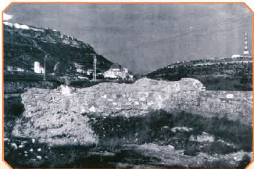
Vista de la antigua Ermita de Santa Elena desde donde se divisa la Ermita de San Antón